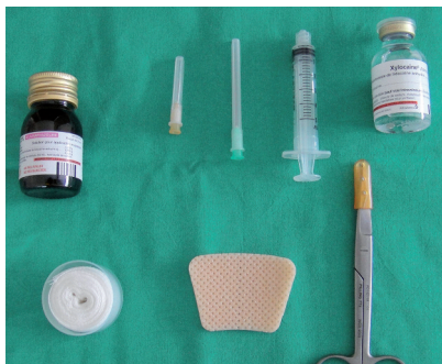
Figure 4. Matériel nécessaire à une réduction des os nasaux.