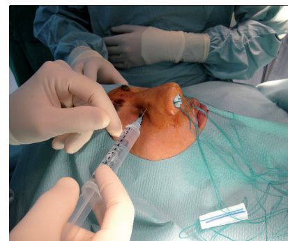
Figure 2. Méchage endonasal à la xylocaine naphthazolinée et injections latéro-nasales.

Ce geste est simple et peut être mené sous anesthésie locale (Fig. 2).