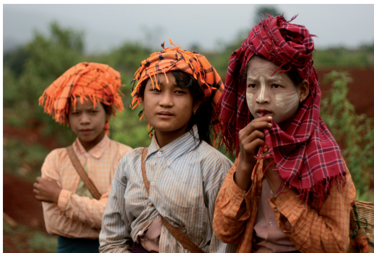
Trois femmes de la tribu Pao, Birmanie

Le plâtre est retiré à 8 jours. La fracture est considérée comme consolidée à un mois. ■