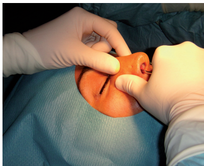
Figure 5. Réduction avec contrôle du geste par la main controlatérale.