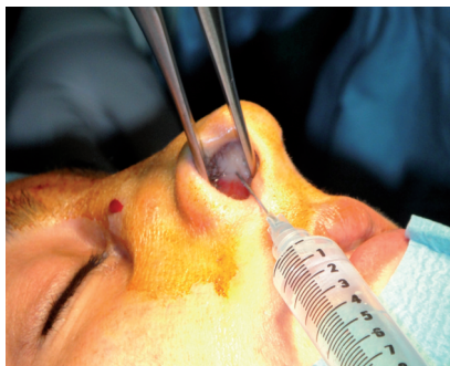
Figure 3. Injections endonasales.